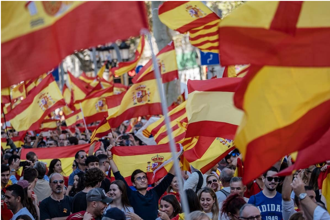
Manifestació a Barcelona amb motiu del Dia de la Hispanitat, el 12 d'Octubre d'enguany.

Malgrat que el procés independentista ha captat l'atenció acadèmica, mediàtica i política, aquestes mateixes esferes han analitzat poc el nacionalisme espanyol català | Pensem.cat hi fa una ullada