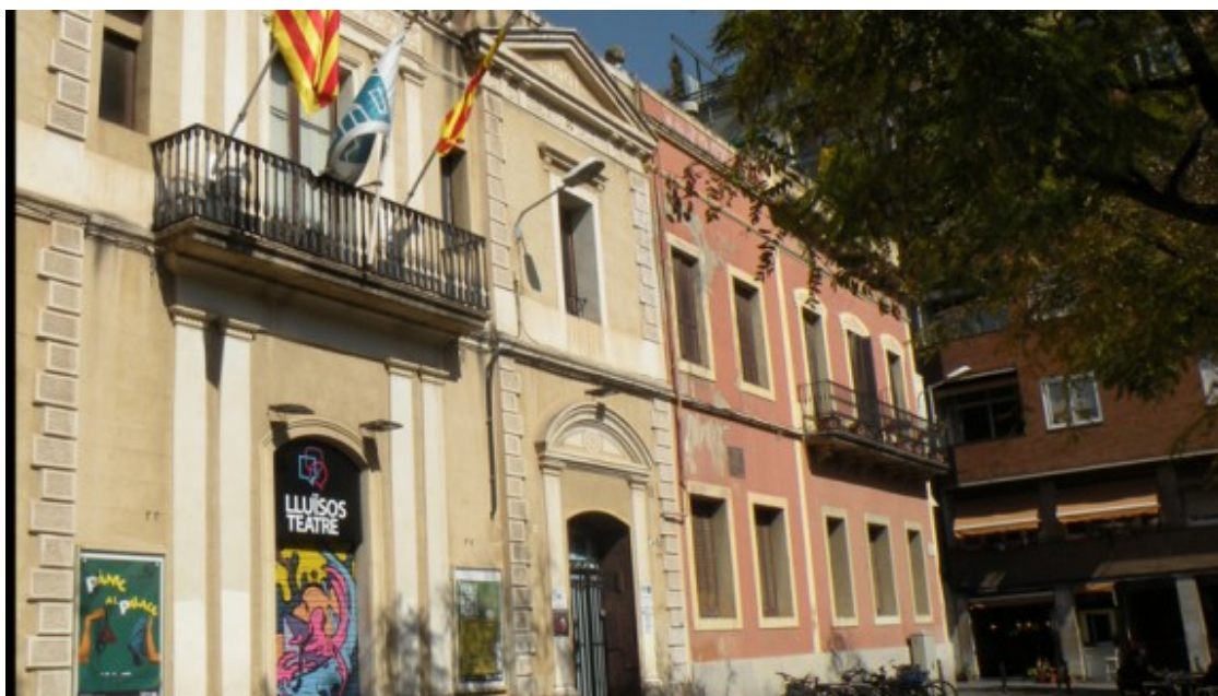
Façana dels Lluïsos de Gràcia.