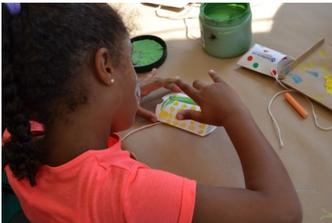
Taller de manualitats organitzat durant la Mercè 2017.