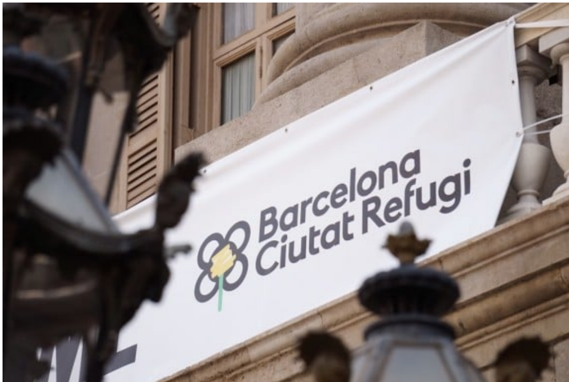
Pancarta de 'Refugees Welcome-Barcelona Ciutat Refugi' a la façana del consistori barceloní.