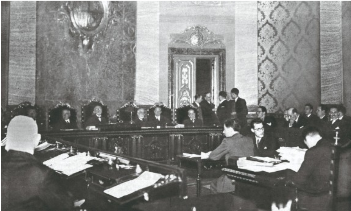
Judici a Lluís Companys al llavors Tribunal de Garanties Constitucionals, que el va condemnar a 30 anys de presó per insurrecció.