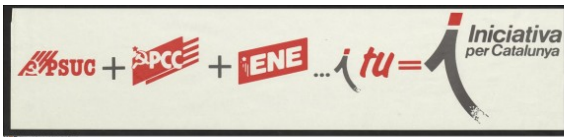
Adhesiu polític de 1987 anunciant la creació d'Iniciativa per Catalunya.

La trajectòria del partit entre 1949-1980, però, el situà novament en el centre de l'escenari català en tant que pal de paller de bona part de la lluita antifranquista. Reivindicant el reconeixement dels drets nacionals de Catalunya -però sense apostar per tesis separatistes- i apostant per la prioritat de l'enderrocament del franquisme en tant que dictadura d'arrel feixista, escrigué una etapa en majúscules de la història catalana. Tanmateix, les contínues escissions internes arran de 1968 i 1979 suposaren també un afebliment per al partit i un dels factors que explicarien la seva trajectòria descendent des de 1980. L'enfonsament de la URSS el 1991, previ naixement d'ICV el 1987 que ja el situava en una esfera deslligada clarament del comunisme soviètic, permeté ubicar la nova formació en un espai de lluita per la qüestió mediambiental, unida a la voluntat de resposta davant la creixent desigualtat social del món globalitzat però, això sí, deixant de banda els esquemes heretats del món comunista i apostant per una lògica no tant distant de les tesis d'una socialdemocràcia , la qual, per la seva part, havia anat virant cap a posicions cada vegada més centristes.