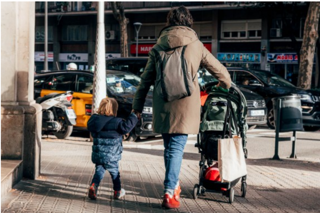
El 1975, l'edat de la primera maternitat era de 25 anys, mentre que el 2019 era de 31.

Per tant, quan arriba el moment de tenir fills/es, és massa tard perquè les dones es puguin reproduir biològicament , i es veuen obligades a recórrer a tècniques de reproducció assistida -amb gàmetes o embrions donats-, l'adopció o la gestació per substitució.