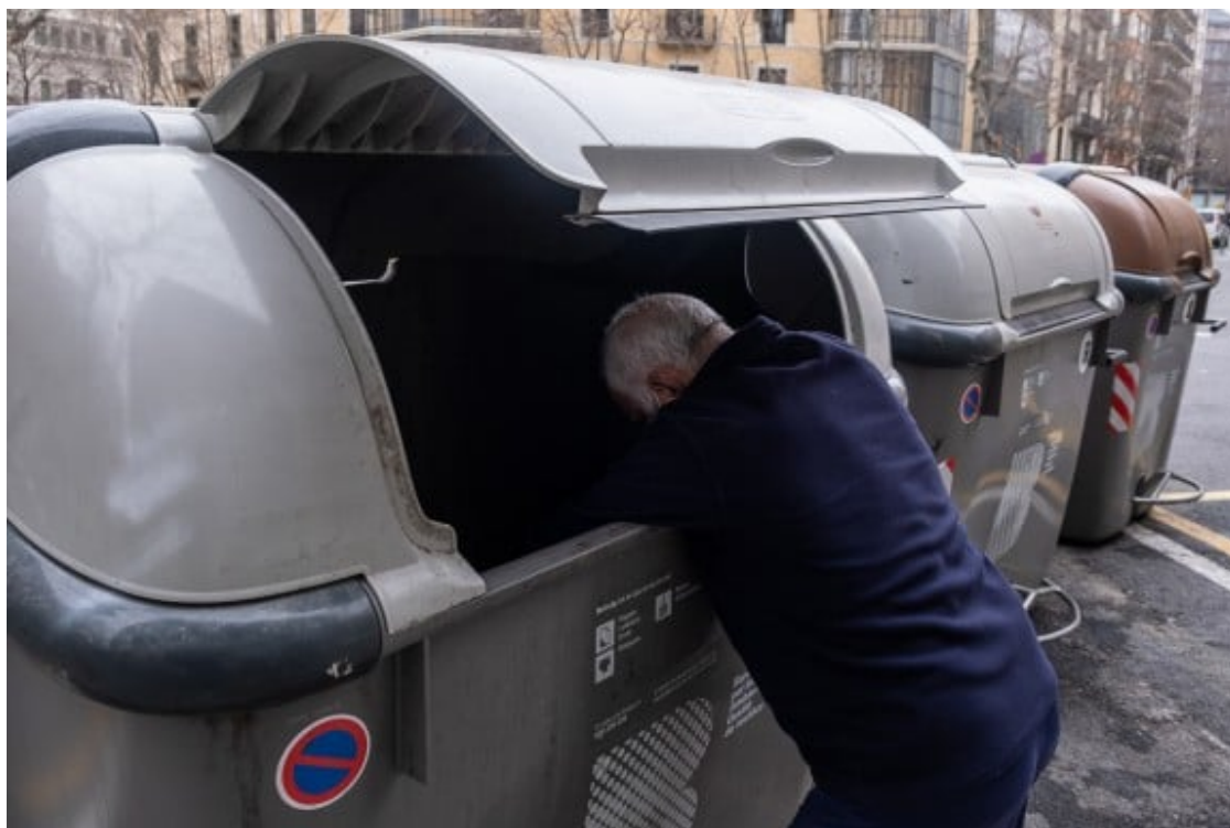
Un home buscant a l'interior d'un contenidor.