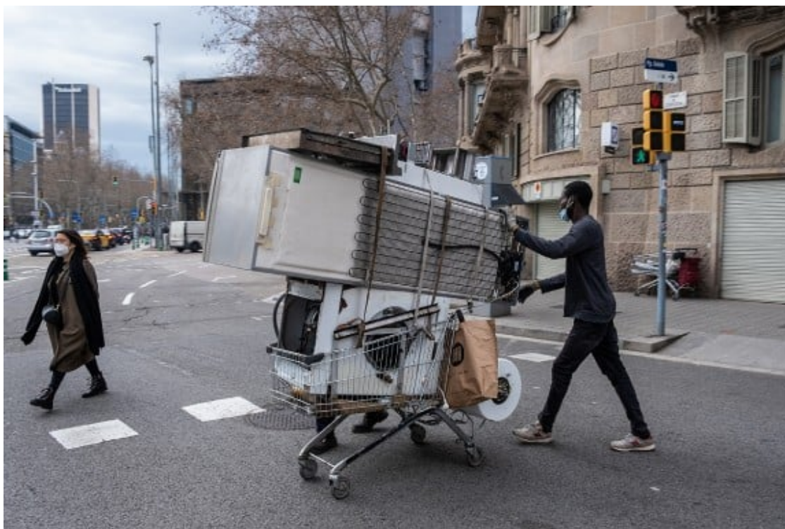
Un ferrellaire al centre de Barcelona.

4. Cap a quotidianitats de mixtura igualitària: polítiques per a construir fraternitat Durant les últimes dècades, les agendes de drets socials han tingut un desplegament feble tant en polítiques urbanes de generació de mixtures, com en polítiques comunitàries on produir els vincles quotidians d'aquestes mixtures. Ni els barris ni les comunitats; ni la justícia espacial, ni els llaços solidaris s'han ubicat entre les prioritats dels règims de benestar europeus. La praxi neoliberal, a més, ha desfermat desigualtats i segregacions, i ha trencat molts dels vincles preexistents.