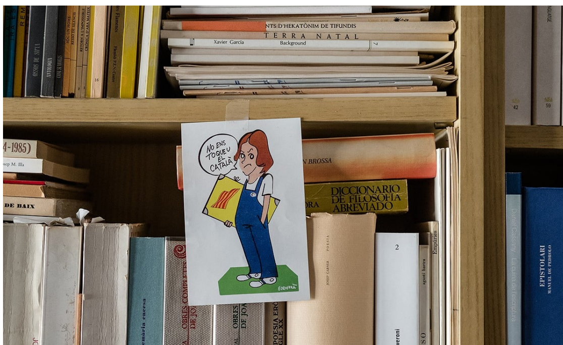
Un dibuix de la Norma enganxat al prestatge d'una biblioteca. | Adrià Costa

Anàlisi del debat a la premsa que, del 2012 ençà, sistemàticament ressurgeix sobre quin hauria de ser l'estatus que hauria de tenir la llengua catalana en el marc hipotètic d'una Catalunya independent