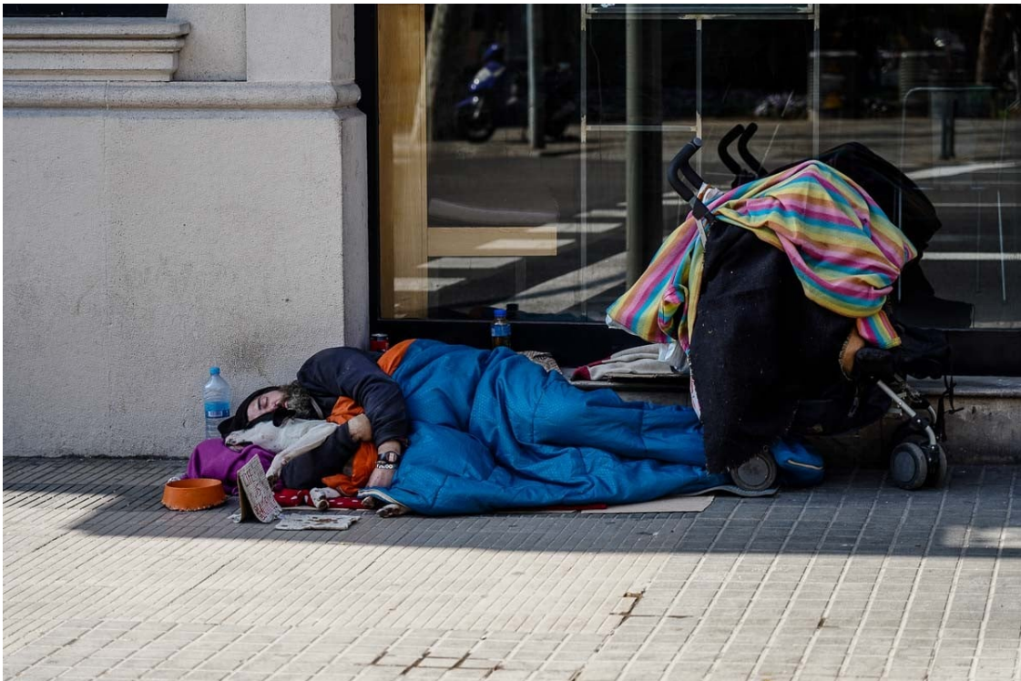
Una persona en situació de sensellarisme al centre de Barcelona.

No són vistes com a víctimes, sinó subtilment com a responsables | Pateixen multitud d'agressions i estan més exposades a patir violència, especialment les dones | Són paradoxalment de les més oblidades tot i ser de les més visibles