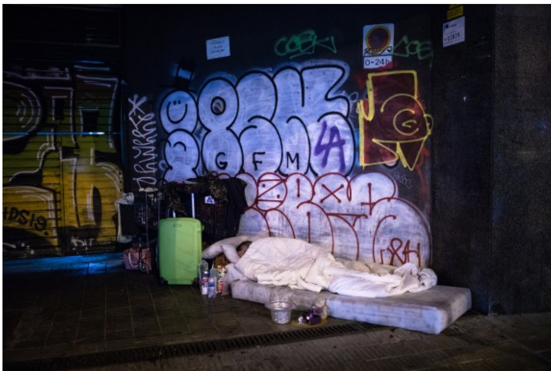
Una persona sense llar dormint al carrer.

L'hostilitat, la soledat i la malaltia incrementen la desesperació de viure el sensellarisme en qualsevol de les seves formes. Un dels indicadors més evidents és l'elevada prevalença de suïcidis (PDF) entre les PES, i com aquesta problemàtica passa àmpliament desapercibuda fins i tot per investigadors sobre salut mental.