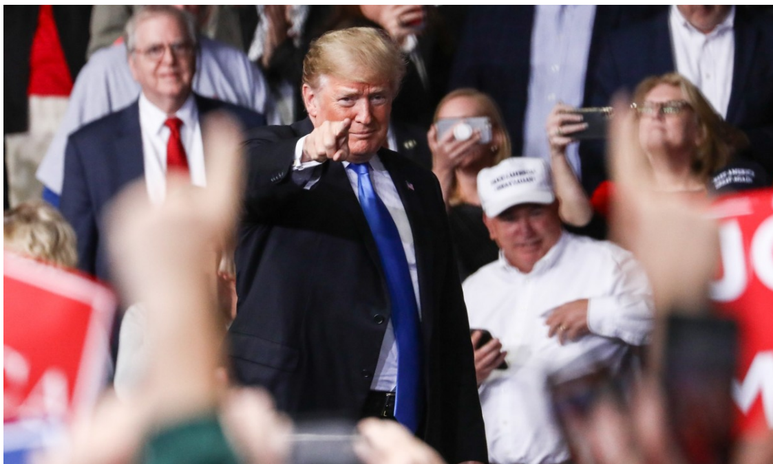
Donald Trump, en un míting electoral a Charlotte.

Deixa un partit dividit entre els que volen seguir-li fidels i els que volen reconduir el rumb | La creença en QAnon és un bon termòmetre per mesurar el suport real que té | La creació d'un tercer partit és pràcticament impossible