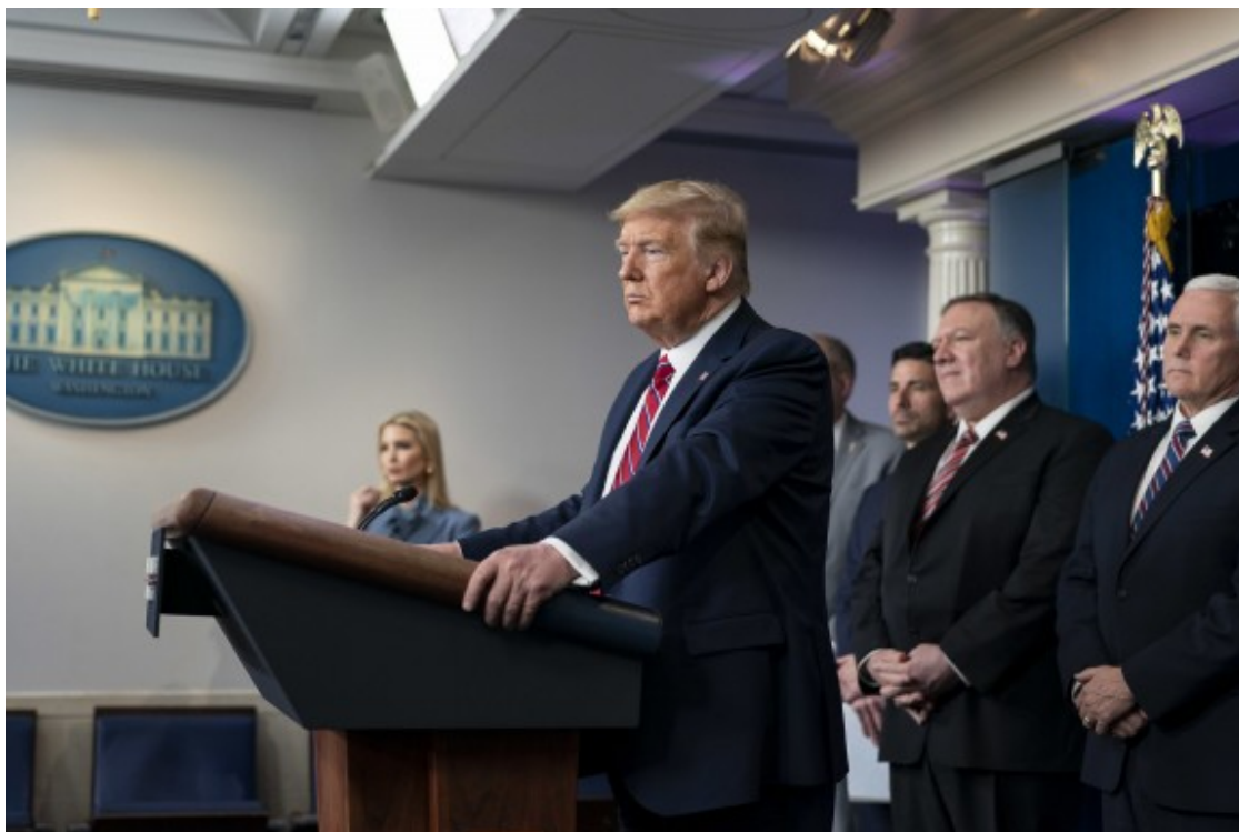
Donald Trump, en una roda de premsa a la Casa Blanca per informar sobre la situació de la CoViD-19, el 20 de març de 2020.

L'acceptació o negació dels resultats electorals és una altra manifestació d'aquest abisme que s'està obrint en la societat americana. De fet, va ser el rebuig dels resultats electorals el que va instigar els manifestants a assaltar el Congrés mentre s'estava celebrant un ple per confirmar el nomenament de Biden. I és que encara ara (les dades són del 15 de gener) el 66% dels votants republicans consideren que Trump segur o probablement va guanyar les eleccions del novembre del 2020.