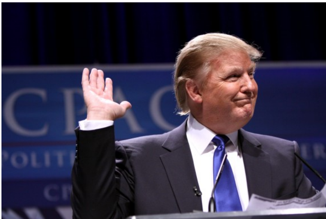
Donald Trump, intervenint a la Conferència d'Acció Política Conservadora d'enguany.

Però el que podria haver estat el primer gran terratrèmol de l'era post-Trump dins del Partit Republicà, va quedar en poc més que un petit sotrac . Finalment, en la votació que havia de declarar culpable Donald Trump, només set republicans van votar a favor de condemnar-lo i, per tant, no es va assolir la majoria necessària de dos terços (67 senadors). Des de llavors, els set senadors que van trencar files amb la resta de companys republicans han estat sotmesos a tot tipus de pressions i crítiques per part de diversos sectors conservadors. Per exemple, la branca del Partit Republicà de Louisiana va emetre un comunicat condemnant enèrgicament el vot (a favor de la condemna de Trump) d'un dels seus senadors, Bill Cassidy. A Michael Whatley, de Carolina del Nord, li va passar una cosa molt similar. I ni tan sols els que van votar per exonerar l'ex-president, però s'hi han mostrat crítics en els darrers mesos, van escapar-se de l'allau d'atacs i acusacions de deslleialtat. Aquests exemples mostren que en els propers mesos (i potser anys) serà molt difícil i costós políticament desafiar el trumpisme des de dins del partit.