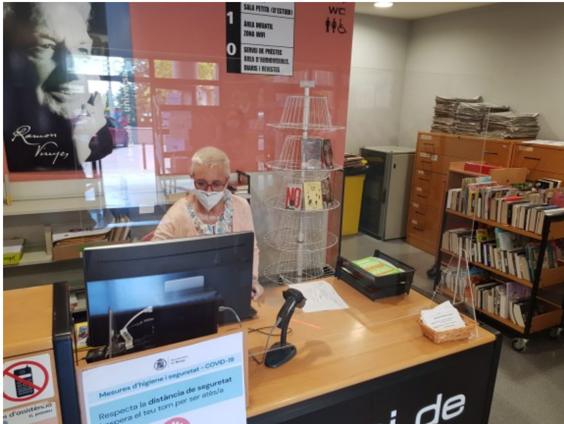
Les biblioteques i centres cívics han vist totalment alterada la seva funció social de garants d'accés a la cultura.

conjuntament amb un centre educatiu. Un equipament o organització cultural pot incorporar la mirada educativa (o la perspectiva de gènere, o el treball territorial comunitari, o la promoció de la salut comunitària, etc.) més enllà de les col·laboracions establertes amb els agents que formalment es dediquen a aquests temes.