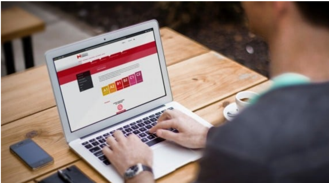
Curs 'on-line' de català.

L'inici del nou curs 2020-21 s'ha dut a terme en un clima d'incertesa davant la possibilitat d'un nou confinament. Al setembre, el Consorci per a la Normalització anunciava els nous cursos, presencials, semipresencials i a distància, i reduïa el preu de les matrícules per facilitar l'aprenentatge en temps de crisi. Tot i això, segons les primeres informacions, el nombre d'alumnes matriculats havia patit una davallada considerable .