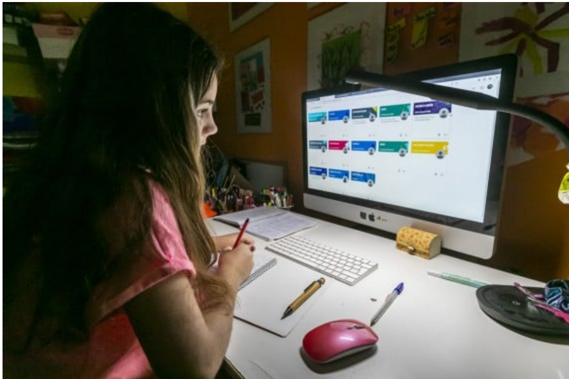
Una noia fent els deures, durant el confinament.

Ho deia Kennedy: "Les obres a la teulada s'han de fer quan fa sol."