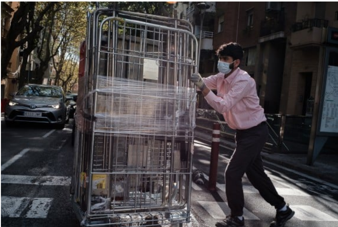
Un treballador d'un supermercat de Barcelona.

La crisi econòmica de 2008 va suposar una primera sacsejada als sistemes de protecció. L'augment de l'atur va provocar un creixement de les prestacions d'atur tant contributives com no contributives. A mesura que les prestacions contributives es van anar esgotant van augmentar els sol·licitants de prestacions no contributives i dels programes de rendes mínimes. Entre 2008 i 2011 el número de llars beneficiàries de rendes mínimes es va duplicar. Les pressions per contenir la despesa van fer que diverses comunitats autònomes endurissin els requisits d'accés, reduïssin les quanties i limitessin la durada de les rendes mínimes. En el cas català, al llarg de 2011 es van introduir modificacions que endurien les condicions d'accés del PIRMI, per tal de reduir-ne la despesa. Es va augmentar el temps exigít de residència a Catalunya, es va introduir un període de carència de 12 mesos, es va limitar la quantia màxima del subsidi i també es van posar topalls a la durada màxima de percepció de la renda. A aquestes mesures s'hi va afegir un discurs que culpabilitzava les persones perceptores i les situava sota la sospita permanent de frau.