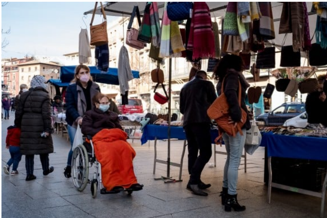
Mercat a Vic.

La impossibilitat d'obtenir informació de les fonts estadístiques habituals probablement estimularà l'explotació d'altres fonts de dades que no se solien utilitzar. Una font evident seran les mostres anuals de microdades de l'IRPF, però ja estan apareixent anàlisis d'altres font de dades que aporten informació valuosa. En un paper recent s'utilitzen registres bancaris anonimitzats per estimar els salaris i els subsidis percebuts pels titulars del comptes. Les dades obtingudes amb aquesta metodologia coincideixen amb les aportades per altres fonts: una part important de la mostra va perdre un part important o tots els ingressos entre febrer i abril i això va afectar particularment les persones amb rendes més baixes.