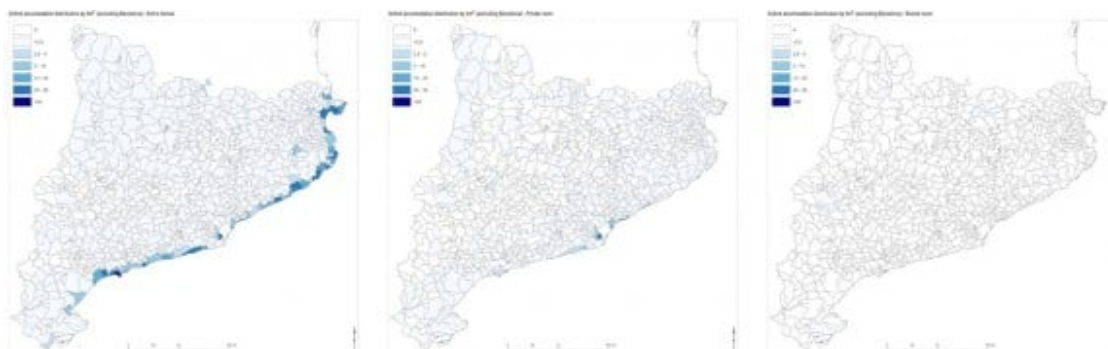
Distribució territorial dels allotjaments d'Airbnb a Catalunya (sense considerar Barcelona) per km 2 i tipologia (2018).

Gràcies a un webscrapping -captura de dades a Internet- realitzat a finals de 2018, es va descobrir que Airbnb ofereix 32.350 allotjaments per a tot Catalunya (16.477 dels quals a Barcelona), incloses les cases/apartaments sencers (que representaven el 86,5% dels allotjaments), habitacions privades (13,2%) i habitacions compartides (0,3%). Sense tenir en compte Barcelona (que s'ha de considerar un cas específic donades les seves característiques particulars), de tots aquests allotjaments, un terç es localitzaven a només nou municipis costaners i a l'Hospitalet de Llobregat , el 50% dels municipis no tenien cap pis o casa en oferta i el 53% en tenia menys de 10. Així, els allotjaments d'Airbnb a Catalunya es concentren a les zones costeres turístiques, amb una oferta nul·la o marginal a la resta de la regió o a les capitals de província, malgrat la seva naturalesa urbana. El nombre de possibilitats de pernoctació que s'ofereixen és particularment elevat a la Costa Brava, amb un 42% del total (també una de les concentracions més altes d'Espanya), seguit de la Costa Daurada (20%) i la Costa de Barcelona (15,5%). A més, la Vall d'Aran és l'única zona no costanera amb nombre important d'allotjaments, ja que cap altra zona rural o interior no apareix molt al mapa d'Airbnb.