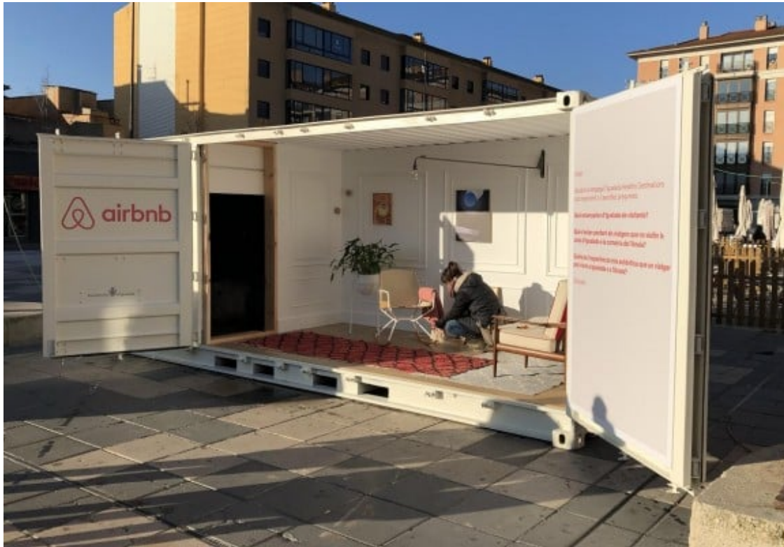
L'Ajuntament d'Igualada va apadrinar efusivament l'arribada d'Airbnb el maig del 2019.

En tot cas, caldrà veure com la crisi derivada de la pandèmia causada per la CoViD-19 impacta en aquest desenvolupament més enllà de l'àmbit urbà, en un moment d'especial transcendència pel sector turístic català i on l'acció reguladora de les administracions serà més rellevant que mai. Mentre que a la ciutat de Barcelona, l'administració ha estat especialment bel·ligerant amb el creixement d'una oferta que s'ha vingut a sumar als factors causants de l' overtourism , els municipis amb més dependència del turisme de sol i platja o aquells de l'interior amb voluntat d'especialització turística han estat més permissius quan no han abraçat decididament l'aterrament de la plataforma als seus territoris. La nova situació derivada de la pandèmia ha provocat una aturada en sec de la mobilitat internacional, molt important per l'allotjament P2P i caldrà veure quina serà la seva capacitat de recuperació a Barcelona i la resta del país, així com les possibles actituds dels reguladors, des d'un potencial laissez-faire a estrictes normatives que limitin aquesta oferta, passant per la possibilitat de pensar en fórmules de co-regulació entre l'administració i les plataformes, el que entenem que seria realment desitjable.