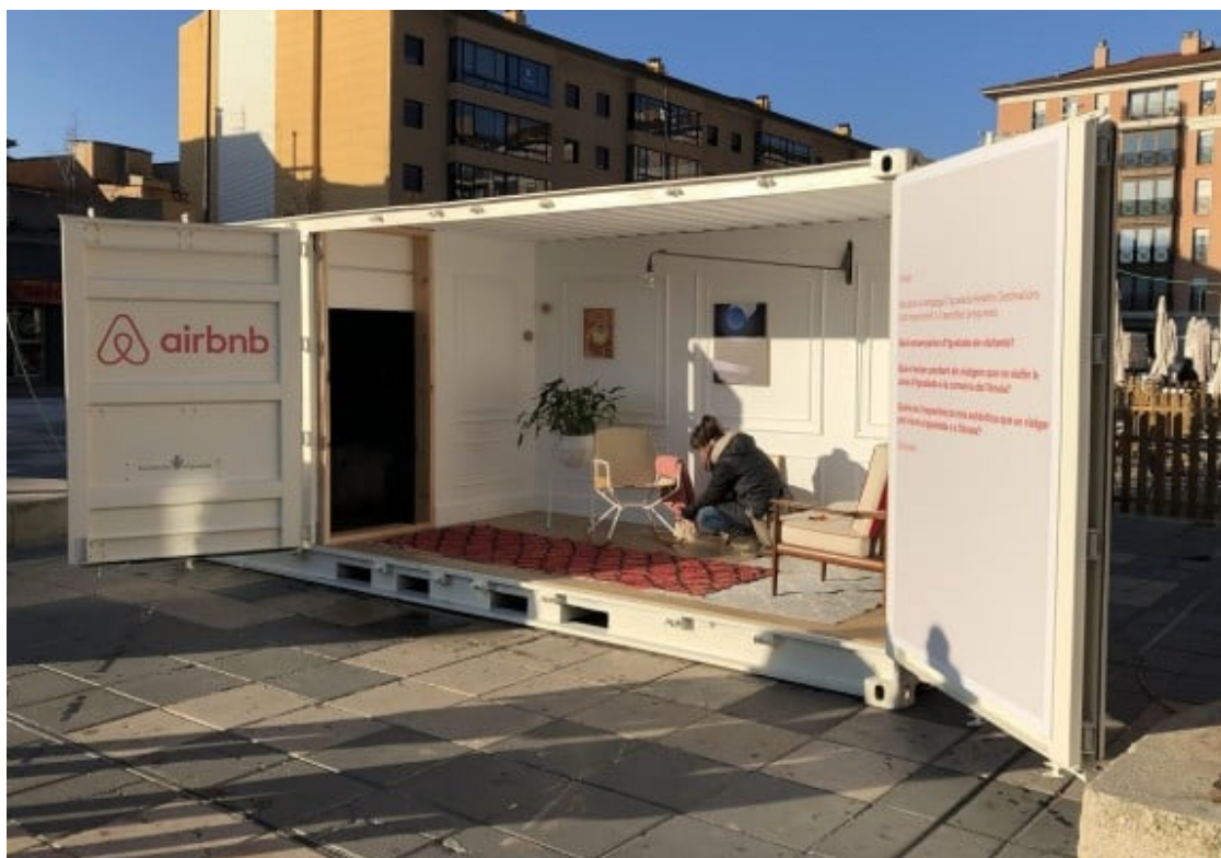
L'Ajuntament d'Igualada va apadrinar efusivament l'arribada d'Airbnb el maig del 2019.

En tot cas, caldrà veure com la crisi derivada de la pandèmia causada per la CoViD-19 impacta en aquest desenvolupament més enllà de l'àmbit urbà, en un moment d'especial transcendència pel sector turístic català i on l'acció reguladora de les administracions serà més rellevant que mai. Mentre que a la ciutat de Barcelona, l'administració ha estat especialment bel·ligerant amb el creixement d'una oferta que s'ha vingut a sumar als factors causants de l' overtourism , els municipis amb més dependència del turisme de sol i platja o aquells de l'interior amb voluntat d'especialització turística han estat més permissius quan no han abraçat decididament l'aterrament de la plataforma als seus territoris. La nova situació derivada de la pandèmia ha provocat una aturada en sec de la mobilitat internacional, molt important per l'allotjament P2P i caldrà veure quina serà la seva capacitat de recuperació a Barcelona i la resta del país, així com les possibles actituds dels reguladors, des d'un potencial laissez-faire a estrictes normatives que limitin aquesta oferta, passant per la possibilitat de pensar en fórmules de co-regulació entre l'administració i les plataformes, el que entenem que seria realment desitjable.