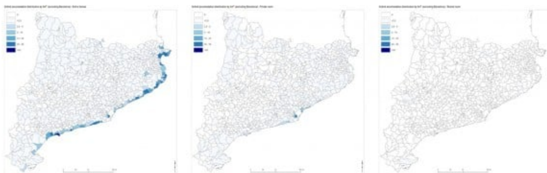
Distribució territorial dels allotjaments d'Airbnb a Catalunya (sense considerar Barcelona) per km2 i tipologia (2018).

Gràcies a un webscrapping -captura de dades a Internet- realitzat a finals de 2018, es va descobrir que Airbnb ofereix 32.350 allotjaments per a tot Catalunya (16.477 dels quals a Barcelona), incloses les cases/apartaments sencers (que representaven el 86,5% dels allotjaments), habitacions privades (13,2%) i habitacions compartides (0,3%). Sense tenir en compte Barcelona (que s'ha de considerar un cas específic donades les seves característiques particulars), de tots aquests allotjaments, un terç es localitzaven a només nou municipis costaners i a l'Hospitalet de Llobregat , el 50% dels municipis no tenien cap pis o casa en oferta i el 53% en tenia menys de 10. Així, els allotjaments d'Airbnb a Catalunya es concentren a les zones costeres turístiques, amb una oferta nul·la o marginal a la resta de la regió o a les capitals de província, malgrat la seva naturalesa urbana. El nombre de possibilitats de pernoctació que s'ofereixen és particularment elevat a la Costa Brava, amb un 42% del total (també una de les concentracions més altes d'Espanya), seguit de la Costa Daurada (20%) i la Costa de Barcelona (15,5%). A més, la Vall d'Aran és l'única zona no costanera amb nombre important d'allotjaments, ja que cap altra zona rural o interior no apareix molt al mapa d'Airbnb.