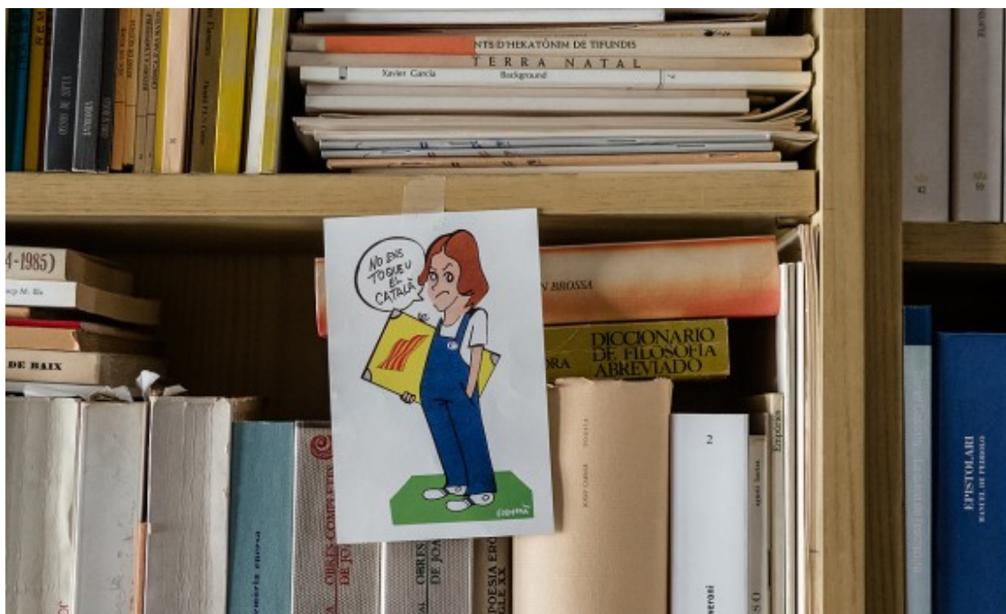
Un dibuix de la Norma enganxat al prestatge d'una biblioteca.