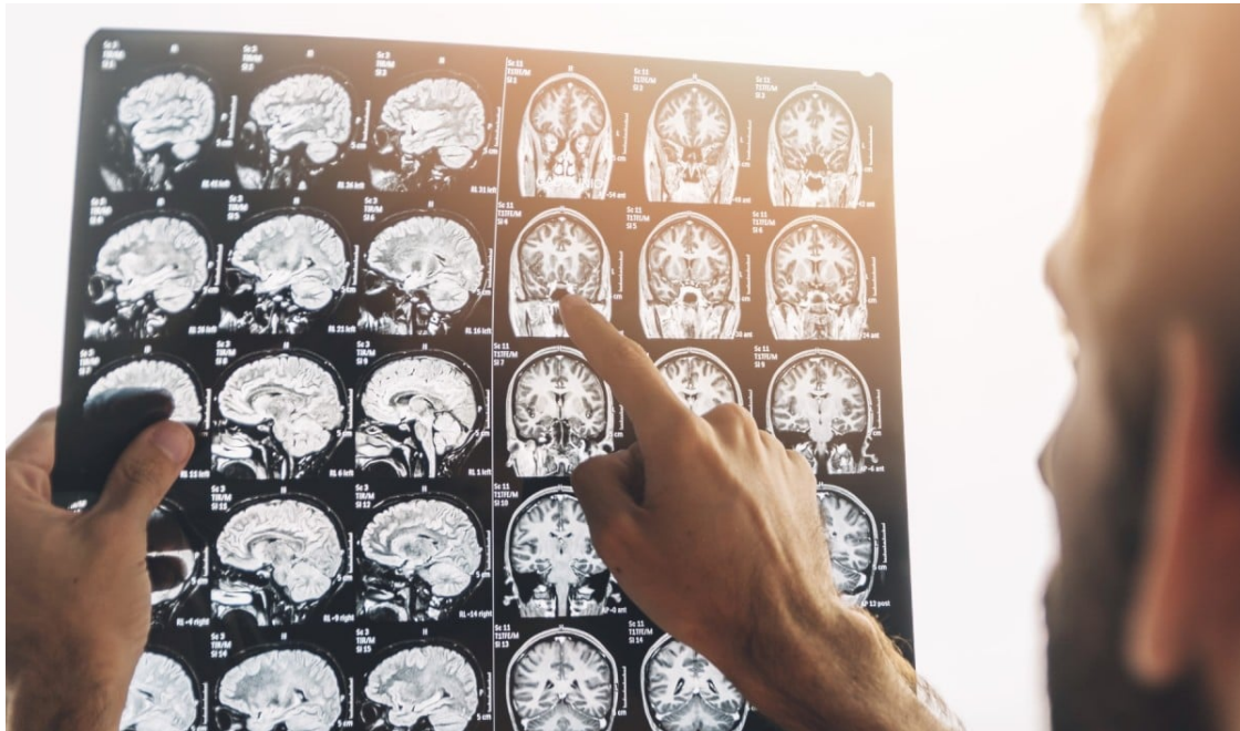
Imatge per ressonància magnètica d'un cervell.

Malgrat les grans quantitats de diners invertits en investigació, encara s'està lluny guanyar la batalla contra la malaltia | Les noves tecnologies poden suposar un salt qualitatiu en la recerca, alhora que poden facilitar la vida de cuidadors i familiars