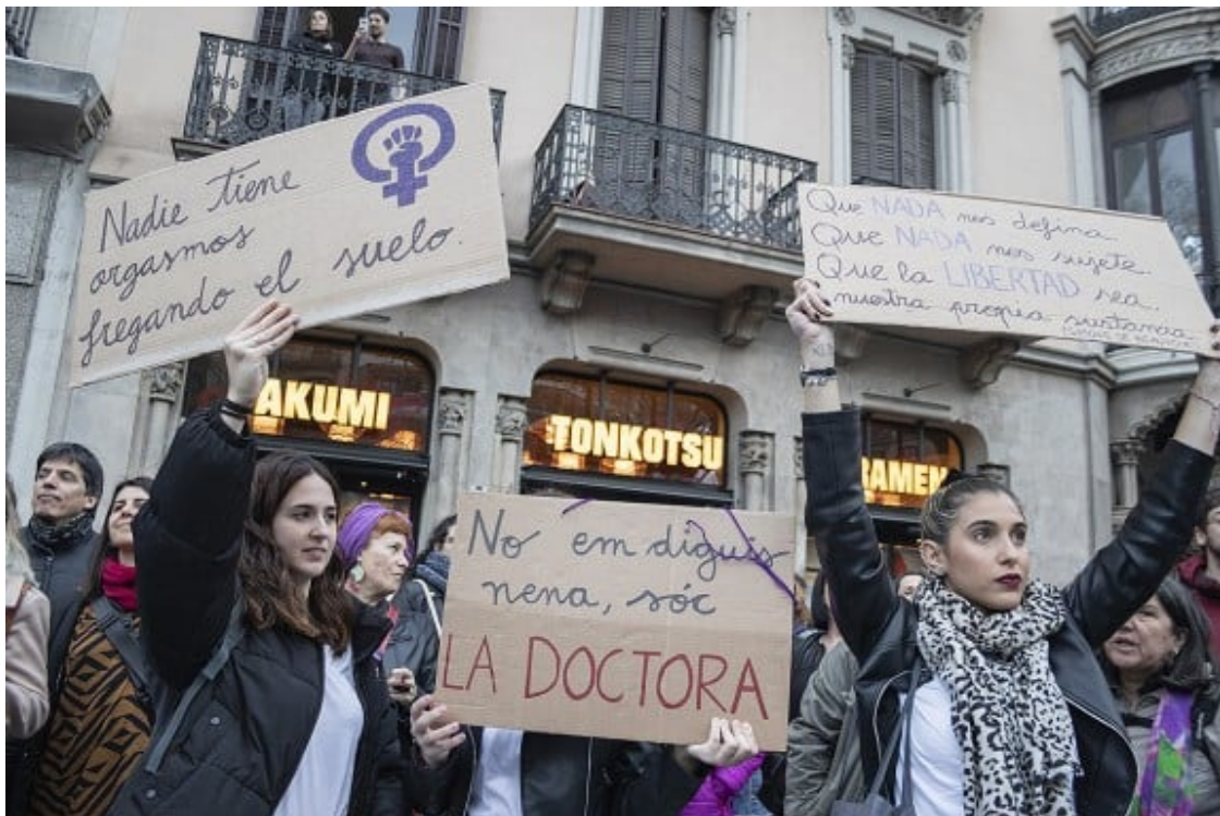
Els nous moviments ciutadans no són només la mostra d'un malestar generalitzat, sinó la constatació de la fortalesa democràtica.

El que representa la desafecció ciutadana respecte del model de representació, tantes vegades qüestionat, resulta ara model i motor per encaminar el procés democràtic, sempre en formació, cap al seu propi auto-reconeixement i per tant, l'assumpció de les seves característiques pròpies. D'aquesta manera, el que els nous moviments ciutadans representen i representaran en el futur no és només la mostra d'un malestar generalitzat respecte a com la societat s'articula, social, política i econòmicament, sinó la constatació de la fortalesa que posseeix la democràcia així compresa .