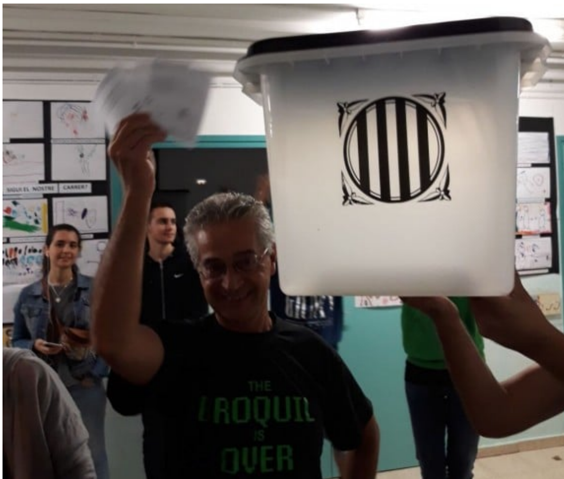
Les votacions de l'1-O, com a constatació que la democràcia insurgent obté resultats.

Amb aquesta crisi de reproducció social, desenvolupada en el temps i sense albirament de superació, s'arriba a la tercera escena encara en procés de construcció i entroncada amb la segona: la crisi de la crisi i el seu futur. Més i millor democràcia o regressió d'aquesta? Seria la pregunta que es pot formular. En aquest sentit, les dinàmiques de crisi operen no només com una finestra d'oportunitat política o un moment d'afirmació i justificació de el poder; sinó que també és important comprendre la forma en què les situacions de crisi estan avui configurades per un conjunt de discursos, dispositius, eines que limiten les situacions, guien les accions i les oportunitats per donar-les-hi sentit.