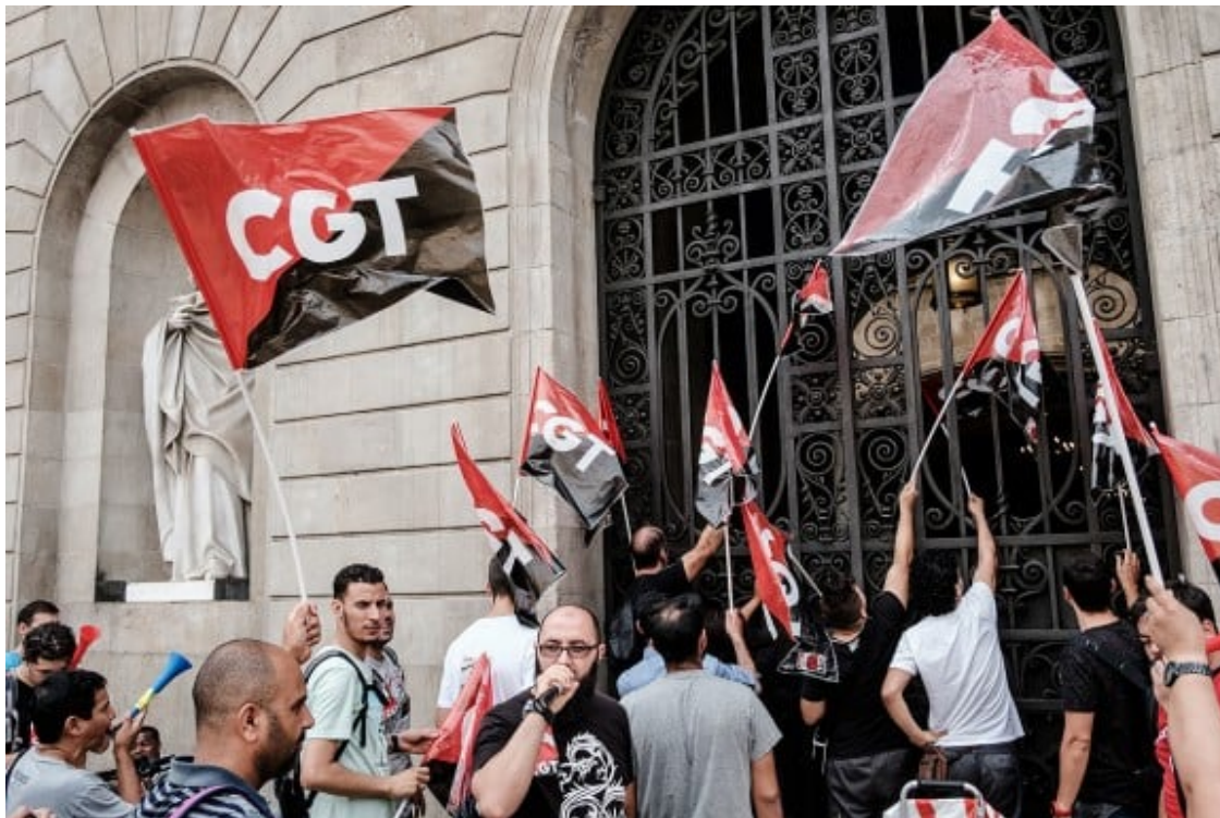
Protesta dels treballadors del Bicing davant l'Ajuntament de Barcelona

Serà, en definitiva, el mateix fenomen de la crisi el qual obrarà com a desllorigador de la situació en la que la democràcia per la seva pròpia naturalesa insurreccional, tal com és apuntat per Miguel Abensour, adquireix una forma latent d'obertura a la possibilitat, ja que no només consolida l'efecte produït, sinó que permet el canvi. Sent aquesta latència pròpia a la democràcia la que ens permet repensar la noció del que és col·lectiu en direcció a l'obtenció de resultats que ha d'arribar per la via de les individualitats en la seva acció concertada.