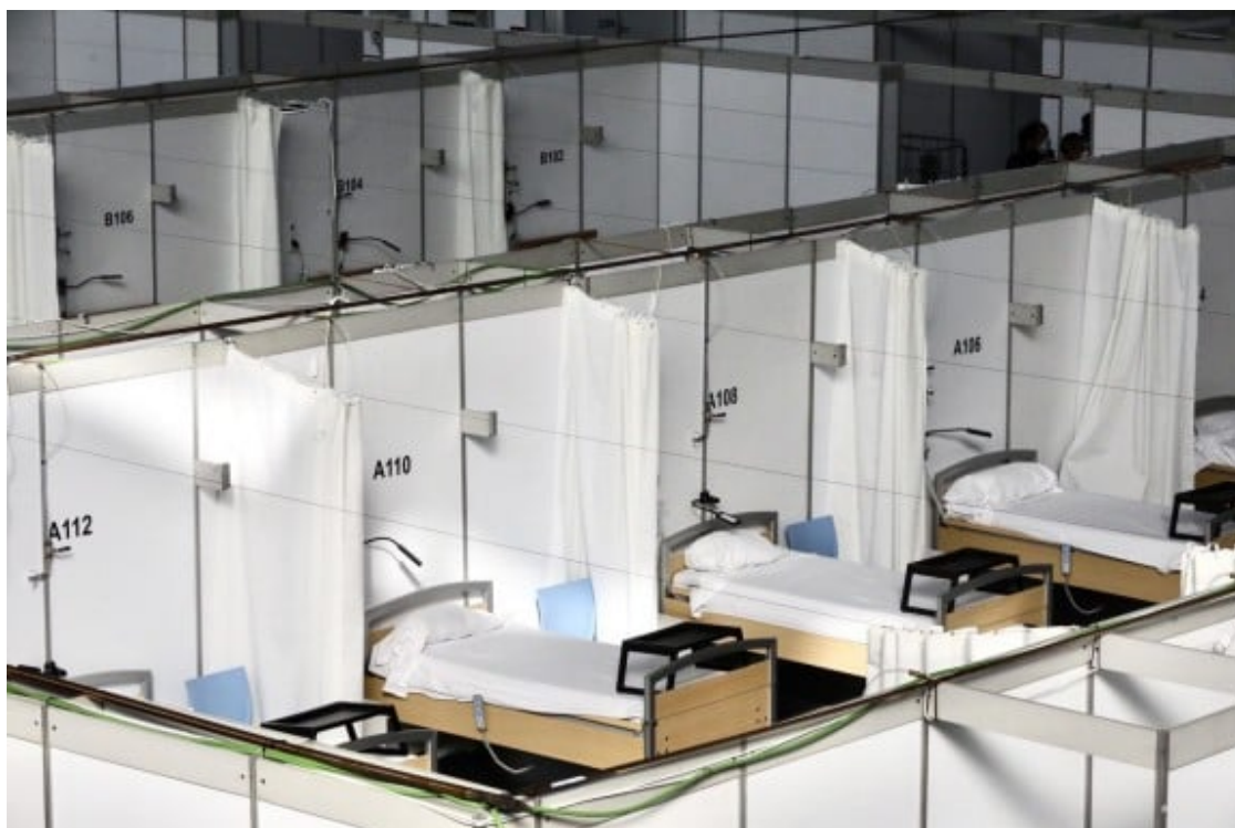
Hospital de campanya instal·lat en un poliesportiu de Sabadell, un 'jamais vu' en la història recent.

passat, mentre s'especula amb allargar la vida quasi indefinidament. El convenciment de seguretat sanitària s'ha emparat del nostre imaginari amb la mateixa fermesa que la por i la incertesa sobre la salut eren mestresses de l'imaginari d'abans. El SARS-CoV-2 ha estat una patacada desconcertant: ara resulta que podem emmalaltir a l'engròs, tots alhora i d'una cosa que no sabem com tractar terapèuticament. No ens en sabem avenir. Per això aquesta pandèmia ens sembla el jamais vu .