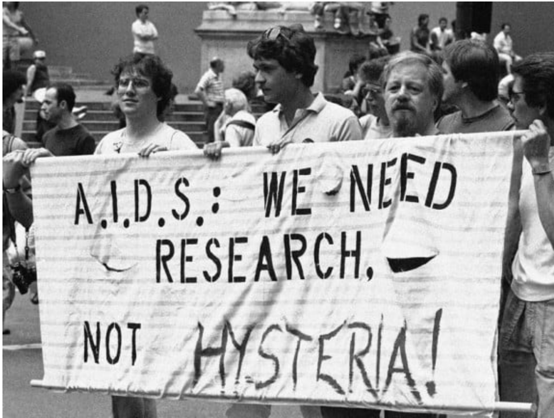
Els inicis de l'epidèmia de la SIDA als EUA van estar marcats per l'estigma i la confusió.

Situació ben diferent de la del còlera, per exemple, malaltia bacteriana que actualment es pot combatre amb antibiòtics sense dificultat. També vaig tenir l'oportunitat de constatar-ho en directe. L'any 1993, l'organització FLACAM (Foro Latinoamericano de Ciencias Ambientales), del Consejo Asesor Internacional de la qual jo era secretari general, rebé del govern argentí l'encàrrec d'intervenir en els episodis de còlera que des de 1992 afectaven el Perú, Bolívia i nord de l'Argentina. Mitjançant acords amb la Fundació Catalana de Gas, de la qual també jo era assessor, vam dissenyar i executar (1994-1997) un projecte d'intervenció, de caràcter no clínic, sinó ambiental: es tractava d'actuar profilàcticament sobre les pràctiques urbanístiques, edificatòries i higiènic-sanitàries, mentre els hospitals s'ocupaven de tractar les persones infectades[5]. L'interès epistemològic del tema residia en el fet que, a final del segle XX, el còlera campava pel centre d'Amèrica del Sud per les mateixes raons que s'havia rabejat en l'Europa del segle XIX: manca d'higiene i contaminació fecal de les aigües de consum. Així doncs, còlera i SIDA feien simultània una diacronia històrica. Constituïen una imatge molt vívida de la nostra contemporaneïtat en un món pretesament globalitzat on coexisteixen moments culturals i civilitzatoris ben diferents. Va ser una lliçó molt clara.