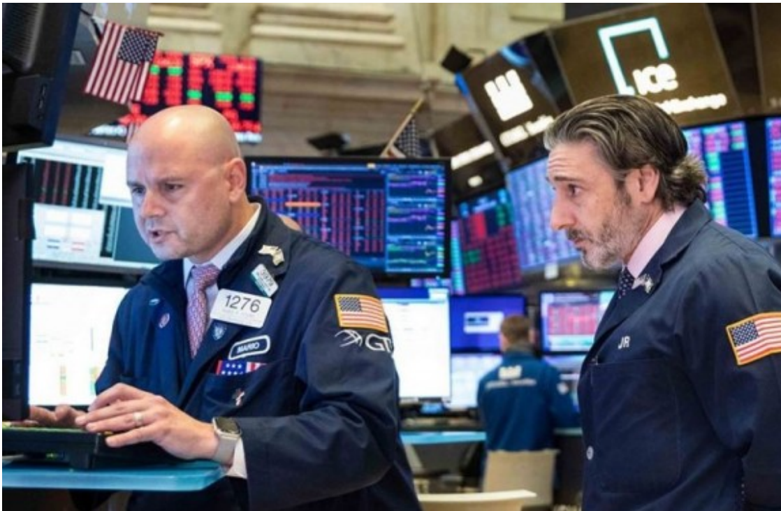
El 18 de març de 2020, la borsa nord-americana va caure de manera abrupta a causa de la crisi del CoViD-19.

Seria un exercici congru amb els processos sostenibilistes en curs i amb la gradual implantació de l'economia circular. Segurament descobriríem que, a sobre, el cop de timó té efectes lenitius sobre el canvi climàtic, sobre la qualitat ambiental i sobre la disponibilitat de temps per part de la