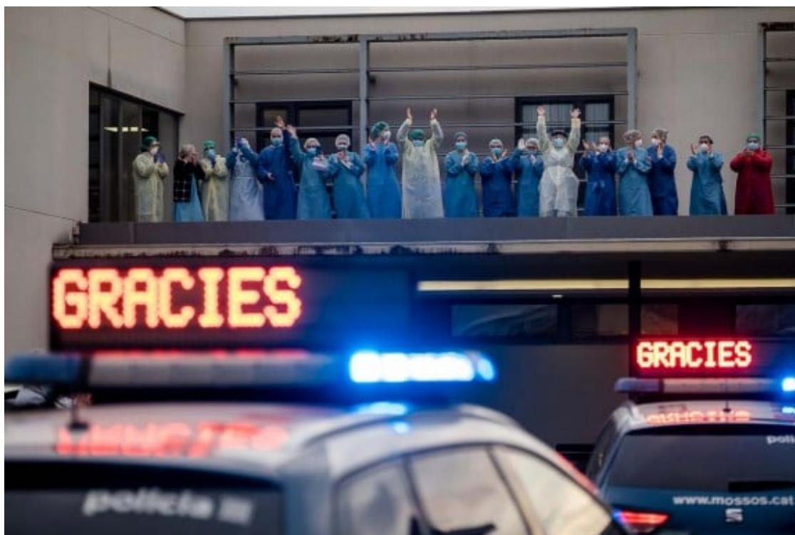
Homenatge als sanitaris de l'Hospital de Manlleu.

Evidentment, molts ulls es giraran cap al sistema públic orientat al Salus ciceronià . La crisi sanitària ha reivindicat la capacitat, el lideratge i el compromís dels professionals que, en primera línia de risc, han hagut de combatre la malaltia generada per aquest microorganisme. I també ha destapat algunes condicions laborals indignes i les vergonyes i febleses de la nostra xarxa d'atenció a la gent gran i altres col·lectius dependents i alhora vulnerables.