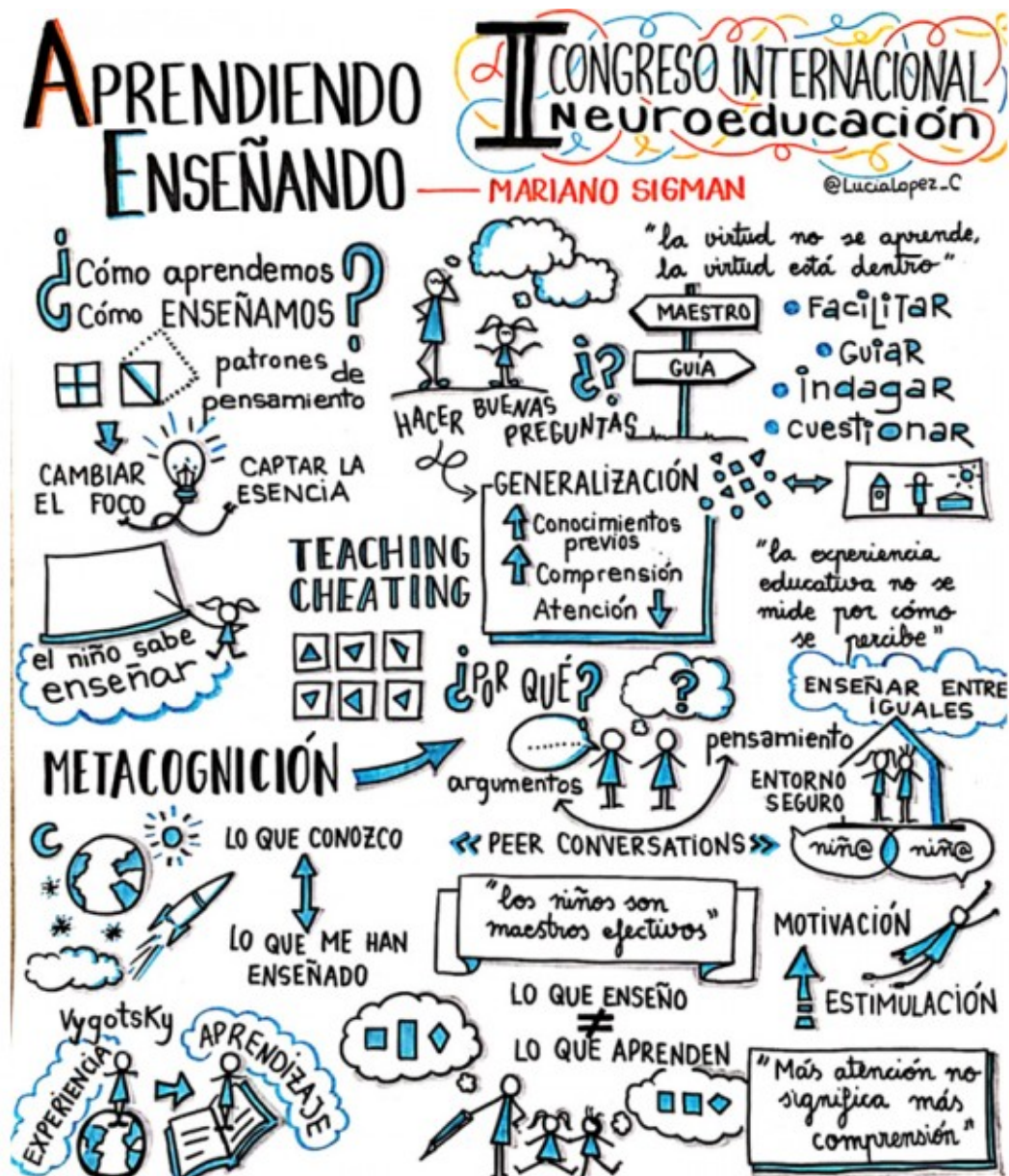
Aprende tot ensenyant. Il·lustració: Lucía López.