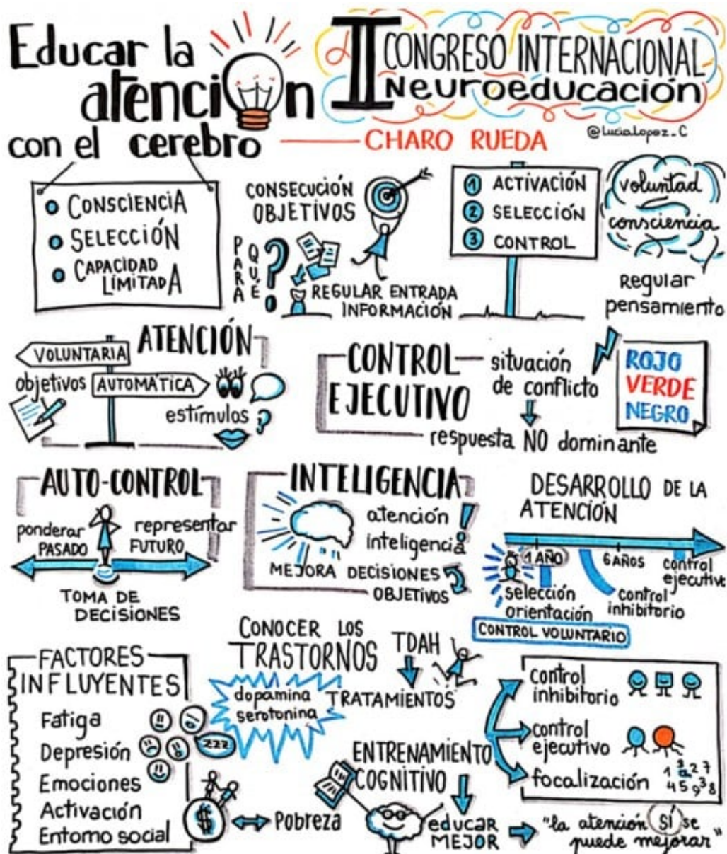
Educar l'atenció amb el cervell. II-ilustració: Lucía López.