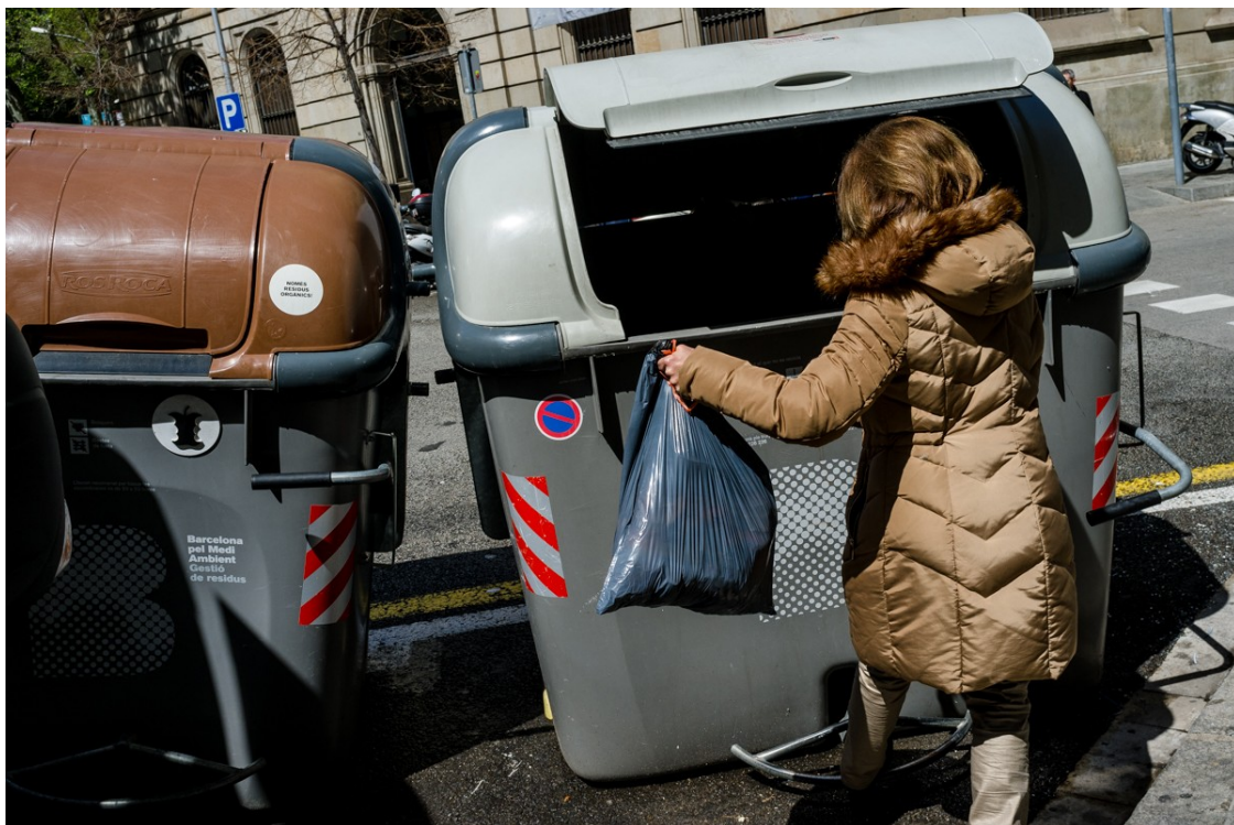
Una ciutadana llençant les escombraries al contenidor.

La motxilla de residus que la societat catalana ha de gestionar dia a dia és enorme | Diverses experiències demostren el potencial de circularitat que podrien tenir la majoria de residus que produïm