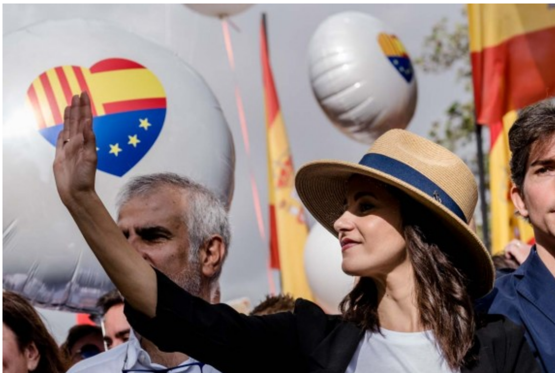
El cor 'tribandera' de Ciutadans, tot un símbol .

Una qüestió també interessant d'explorar és la de l'abstenció, un fenomen que sembla vinculat, en certa manera, a l'espanyolisme a través de l'interès declarat per la política. D'acord amb l'estudi de Medina (2015) de les eleccions al Parlament de Catalunya de 2015, el grup dels que se senten únicament espanyols tendeix a abstenir-se en un 40,4%, percentatge que només baixa fins al 32,3% entre els que se senten tant espanyols com catalans. Curiosament, els que se senten més espanyols que catalans presenten una menor abstenció, amb un 24,1%, però encara major dels que se senten catalans o més catalans que espanyols. A falta d'una validació estadística, aquesta aparent poca vinculació amb la política catalana podria ser conseqüència de l'esmentada "distància" respecte a Catalunya. En tot cas, aquesta qüestió mereixeria d'un estudi en profunditat.