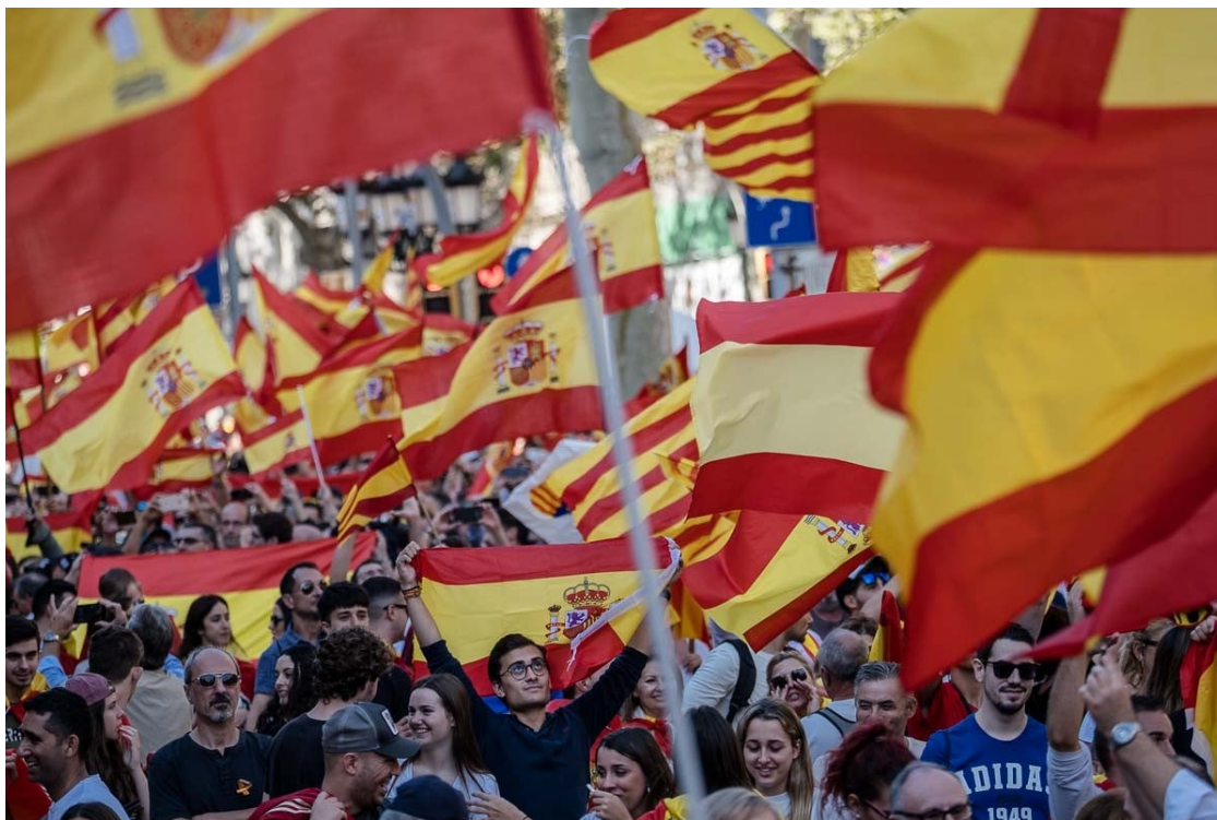
Manifestació a Barcelona amb motiu del Dia de la Hispanitat, el 12 d'Octubre d'enguany. | Adrià Costa.

Malgrat que el procés independentista ha captat l'atenció acadèmica, mediàtica i política, aquestes mateixes esferes han analitzat poc el nacionalisme espanyol català | Pensem.cat hi fa una ullada