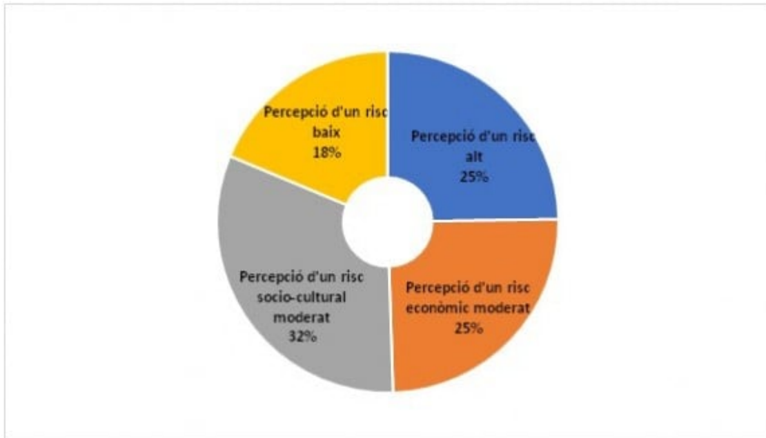
Gràfic 1: Anàlisi clúster de la percepció de risc dels residents.

Els resultats obtinguts han mostrat que davant del desenvolupament de noves modalitats turístiques existeix una percepció de risc entre la majoria dels residents . Això no obstant, la percepció del risc en el desenvolupament dels lloguers vacacionals P2P no és homogènia; sinó que presenta diverses sensibilitats envers els canvis que aquesta modalitat d'allotjament està produint a l'entorn turístic a l'illa de Mallorca. Si bé els resultats han mostrat l'existència d'un sentiment de por o neguit cap a la incertesa que es produeixin impactes negatius com a conseqüència de la implementació dels lloguers vacacionals P2P, això no implica que es tradueixin en impactes negatius de forma immediata.