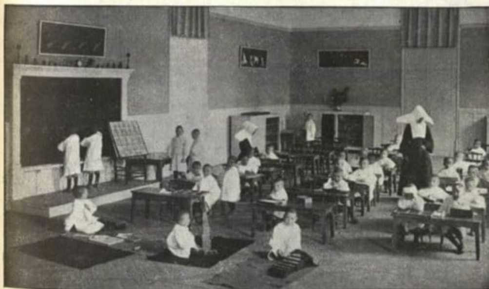
LA MATEIXA CLASSE TRANSFORMADA PEL MÈTODE MONTESSORI La vera disciplina de la lliure activitat aplicada a un treball autoeducatiu