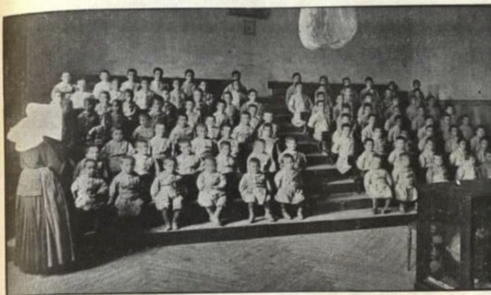
CLASSE DE PÀRVULS TRADICIONAL La falsa disciplina del quietisme estèril