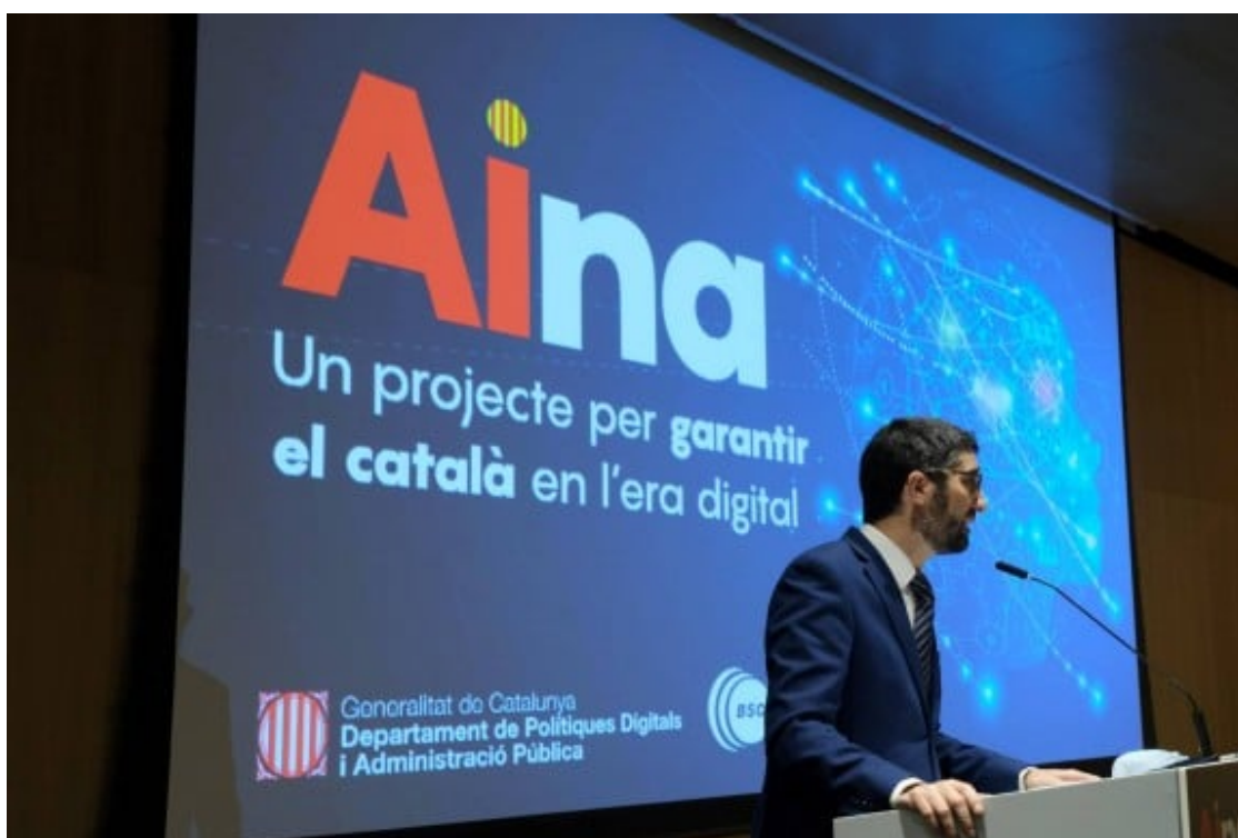
Presentació pública del 'projecte AINA', el 10 desembre de 2020.

Quins actors o recursos caldria activar perquè fos possible?