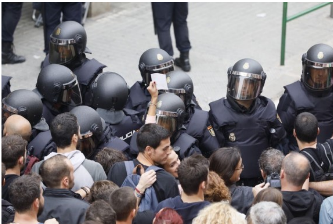
La Policía Nacional, encerclant la gent per treure les urnes d'una escola de Sabadell.

En aquest procés de normalització, El País hi va jugar un paper clau, reproduint i expressant la posició ideològica del partit governant , el Partit Popular (PP). El diari, de fet, es va fer seu el llenguatge i la terminologia del govern, tant als títols dels articles com als de les seccions, els titolets, els enfocaments..., mostrant un "nosaltres" i un "ells" nítid (Foucault 1972, Martín Rojo 1995). En aquest escenari, "ells" -el govern català i els separatistes- eren els que provocaven i desobeïen, emprenien accions il·legals i trencaven Espanya i la seva unitat. I també eren els responsables de les agressions i fins i tot de la mort -la mort de la democràcia.